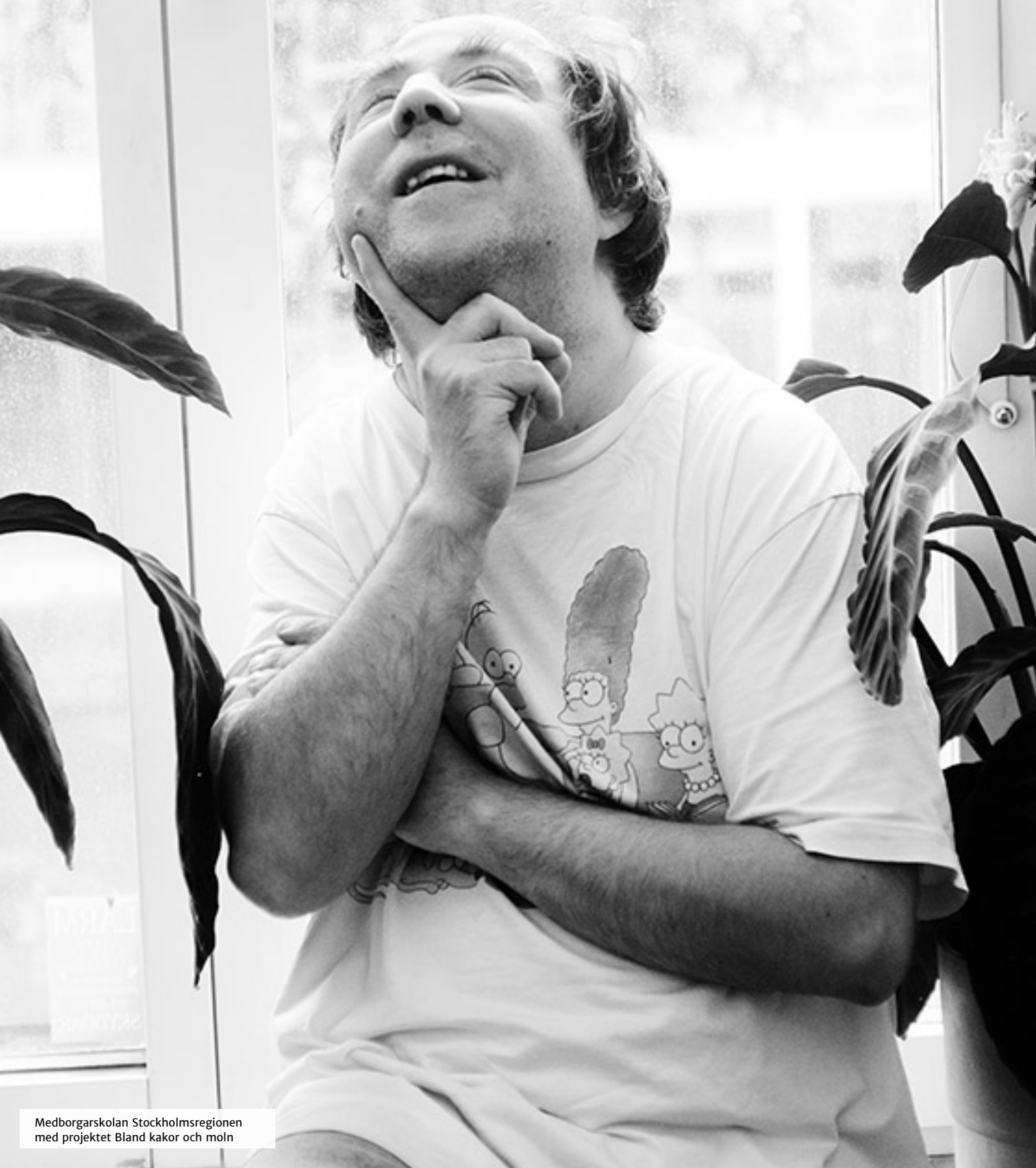
Medborgarskolan Stockholmsregionen med projektet Bland kakor och moln