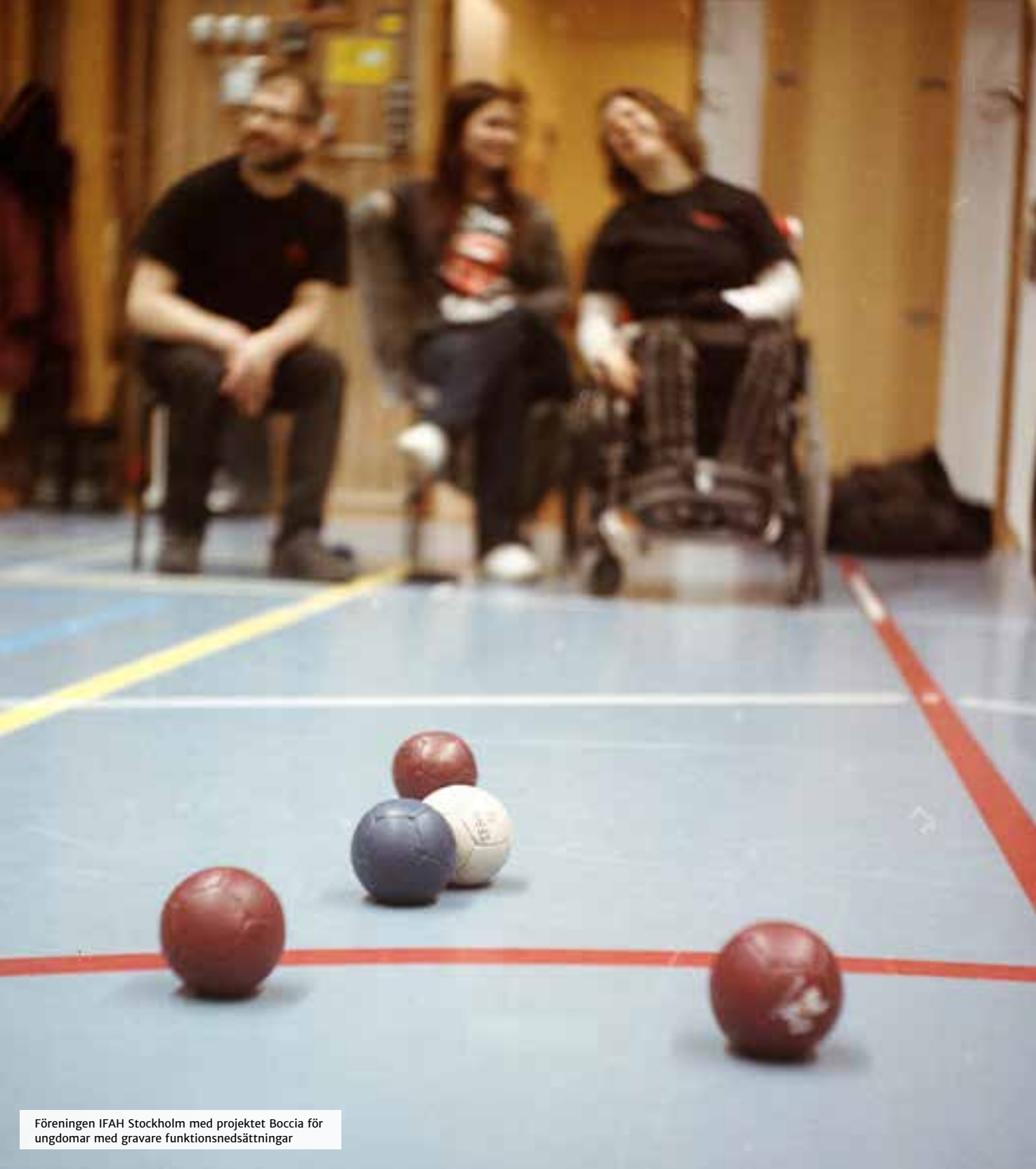
Föreningen IFAH Stockholm med projektet Boccia för ungdomar med gravare funktionsnedsättningar